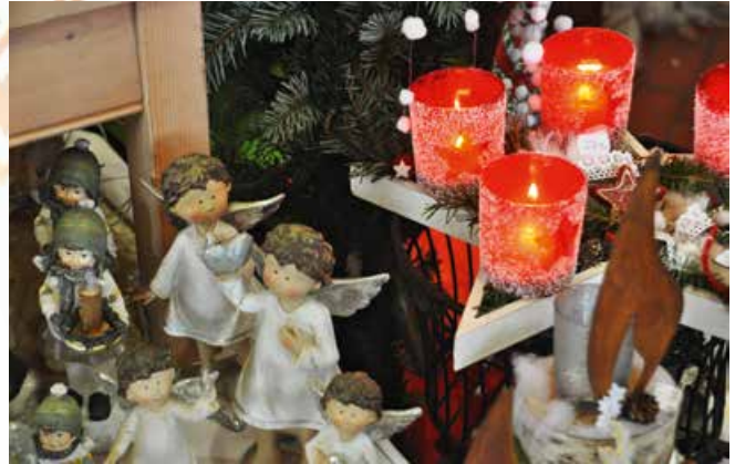
Mit Entzünden der vierten Kerze steigt bei den Kindern die Vorfreude auf auf Heiligabend.