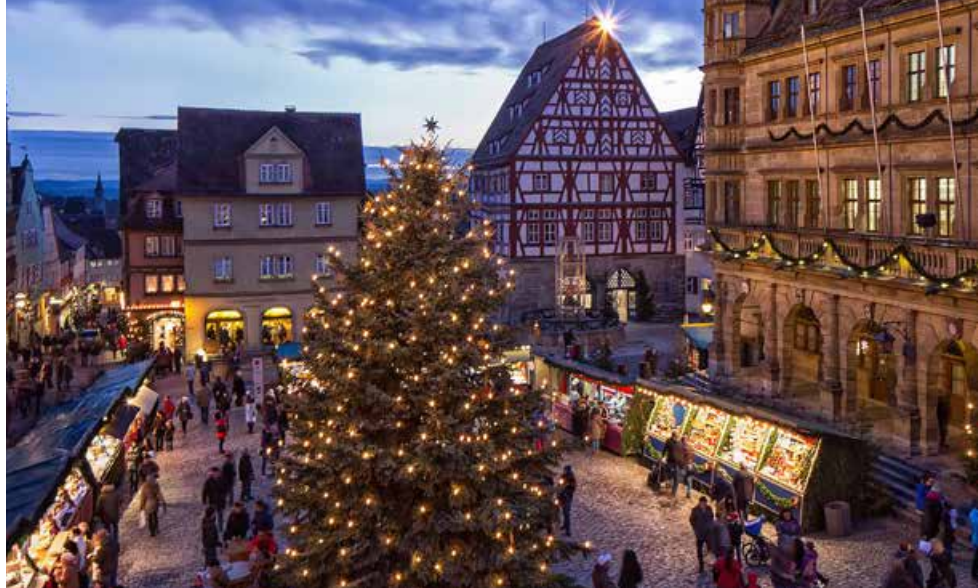
Der Rothenburger Reiterlesmarkt ist einer der Besuchermagnete der Tauberstadt.