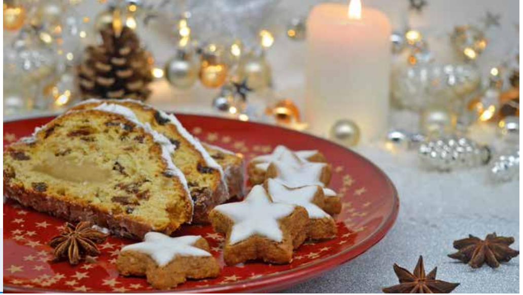
Hübsch angerichtet verführen Stollen und Zimtsterne zum Naschen