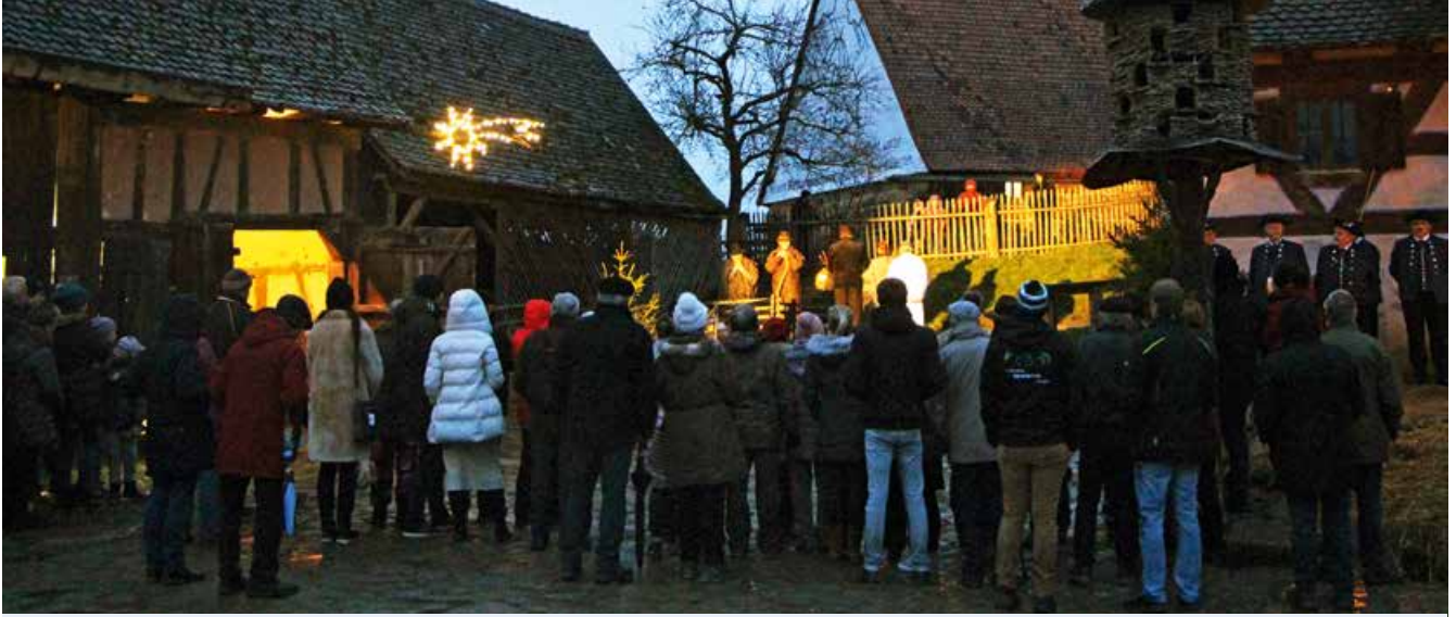
Das Weihnachtsspiel nach Hans Sachs beschließt stimmungsvoll die Museumssaison 2022.