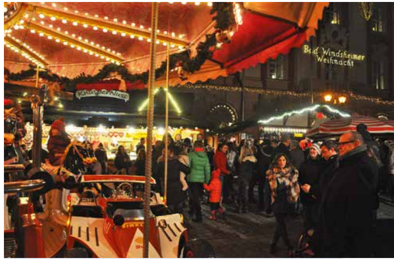
Nach Einbruch der Dunkelheit erwärmen Lichterglanz und Budenzauber die Herzen der Besucher.

In Bad Windsheim können sich Besucher vom 25. November bis zum 18. Dezember vom Ambiente des kleinen aber feinen Marktes mit dem historischen Rathaus im Hintergrund verzaubern lassen. Jeweils Donnerstag