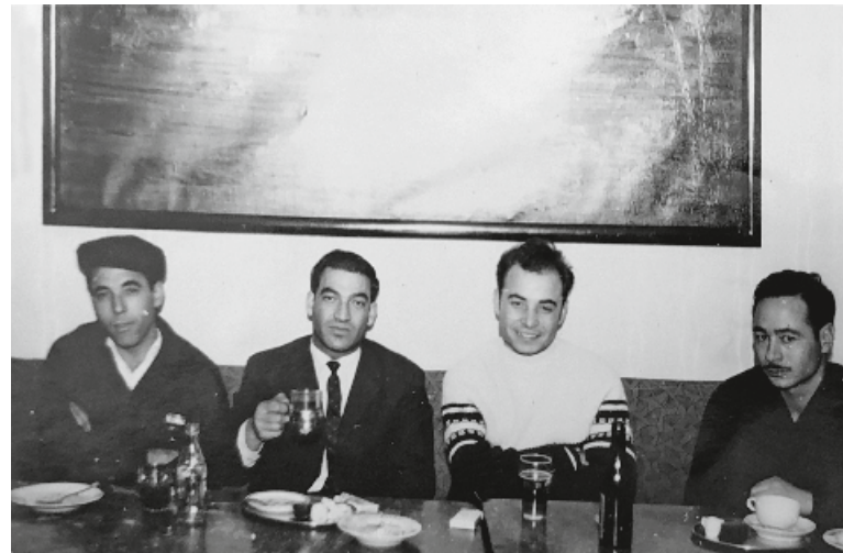
Wer kennt diese Männer oder den Fotografen? Hinweise bitte an die Redaktion der Inspiration.

Ergänzend dazu will der Historische Verein Alt-Windsheim in seinem Museum im Ochsenhof die Migration in Bad Windsheim dokumentieren. Viele Mitbürger, die teils in zweiter und dritter Generation in der Kurstadt wohnen, sind Teil des öffentlichen Lebens, verwurzelt in der Kurstadt. Dies anhand eines ausgewählten Personenkreises mit unterschiedlichsten kulturellen, beruflichen und persönlichen Hintergründen sichtbar zu machen ist das Anliegen des Vereins. Wobei der Blickwinkel der Alt-Windsheimer sich bis in die Gegenwart erstrecken soll und damit die ideale Fortsetzung der Ausstellung des Fränkischen Freilandmuseums werden kann.