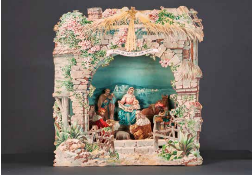
Neben Ausstellungen zu Architekturzeichnungen oder dem Malerhandwerk lädt die beeindruckende Papierkrippenausstellung zum weihnachtlichen Museumsbesuch.