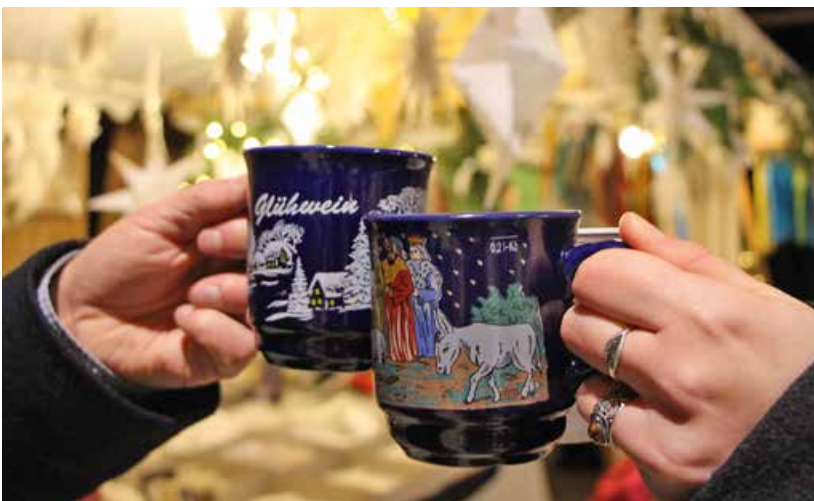
Heißen Glühwein, kunstvolle Geschenkideen und mehr gibt es beim MuseumsWeihnachtsMarkt im Alten Bauhof.

Freilandmuseums-Fans müssen jedoch nicht traurig sein, denn es warten wieder einige Winteröffnungstage , um die Zeit bis zum Start der Museumssaison 2023 Anfang März zu verkürzen: Das Museum Kirche in Franken in der Spitalkirche öffnet an beiden Weihnachtsfeiertagen – Sonntag, 25. Dezember, und Montag, 26. Dezember, von 13 bis 16 Uhr – und bietet damit die Gelegenheit, die beeindruckende Papierkrippen-Ausstellung nochmals zu besichtigen. An Heilig Drei König, 6. Januar 2023, öffnet neben dem Museum Kirche in Franken auch das Hauptgelände des Fränkischen Freilandmuseums seine Tore und lädt zum ersten Flanieren im neuen Jahr. Mit etwas Glück zeigen sich Baugruppen und Natur von 10 bis 16.30 Uhr im weißen Winterkleid von ihrer besonders glanzvollen Seite!