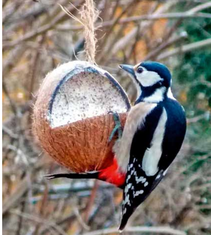
Bei richtiger Fütterung sind auch seltenere Gäste in den heimischen Gärten zu sehen.

aufzustellen, damit die Vögel heranschleichende Katzen frühzeitig bemerken. Sollten Tauben und Rabenvögel vom Futterplatz ferngehalten werden, kann ein Maschendraht um das Häuschen, das kleinere Singvögel durchlässt, helfen. Spezielle Futterstationen gibt es auch für gefederte Freunde, die ihr Futter lieber am Boden suchen. Wichtig ist auch, dass die Futterstellen frei einsehbar sind, damit sich Mäuse und Ratten nicht im nahen Gebüsch verstecken können. Wer die Ratschläge des Landesbundes für Vogelschutz beherzigt, wird sich am Anblick der Vögel erfreuen können. Diese und weitere, ergänzende Informationen sind auch im Internet auf der Seite des LBV zu finden: www.lbv.de