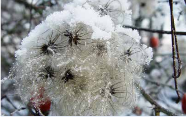
Minusgrade sorgen in der Natur für unvergleichliche Schönheit.