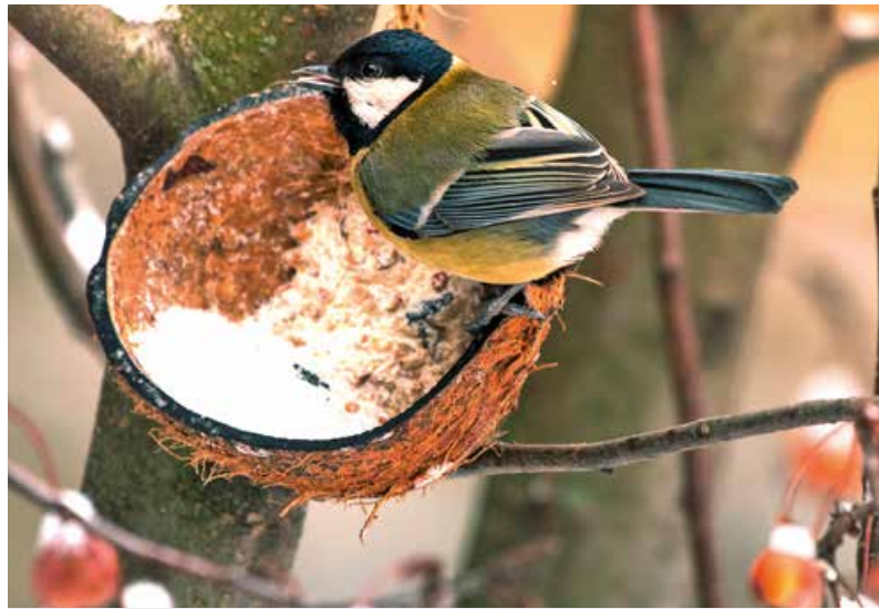
An frostreichen Tagen nehmen Vögel Futterstellen gerne an.

Kohl- und Blaumeise, Amsel, Haus- und Feldsperling oder Grünfink sind Arten, die in der kalten Jahreszeit häufiger im Garten anzutreffen sind. Mitunter sind auch Spechte dankbar für angebotene Nüsse, deren Schalen sich dann unter dem bevorzugten „Rastbaum“ finden. Grundsätzlich gilt: Die Futterstelle muss so gebaut und platziert werden, dass das Futter nicht nass werden kann. Aus hygienischen Gründen ist es auch ratsam, Körner und Samen lieber an mehreren kleinen statt einer großen Futterstelle anzubieten. Wichtig ist außerdem, dass kein Kot ins Futter gelangen kann, weil sonst die Gefahr der Ausbreitung von Krankheiten besteht und damit mehr Schaden als Nutzen angerichtet wird. Futtersäulen und Silosysteme sollten daher